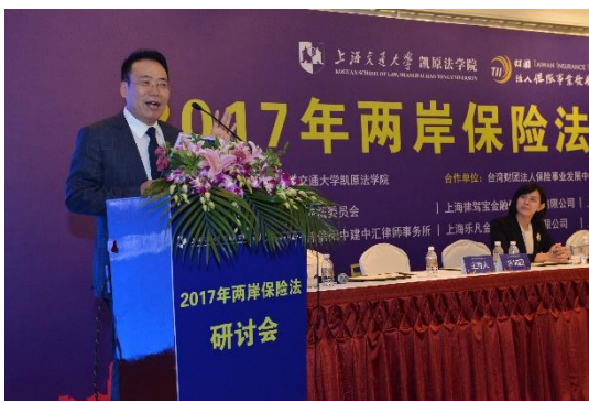
2017年兩岸保險法研討會-閉幕式