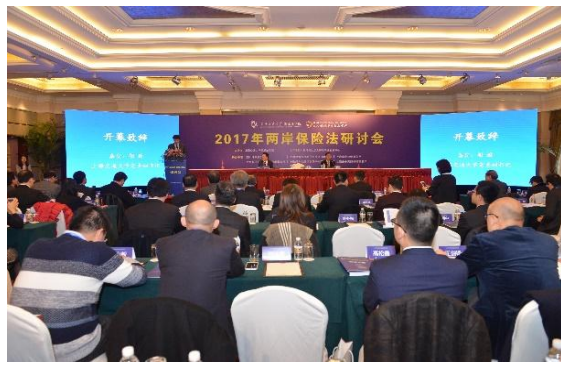
2017年兩岸保險法研討會-全場