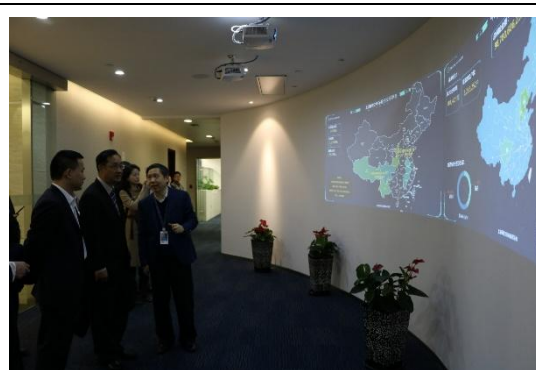
保交所線上展示數據資料