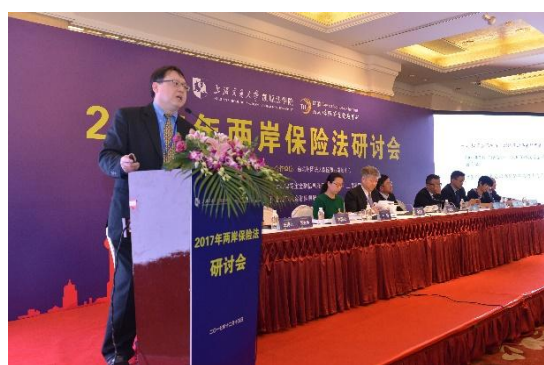
第一議題：人身保險合同疑難問題研究