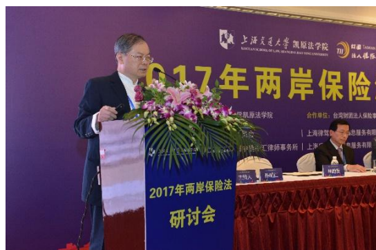
主旨演講：保險法理論的新發展