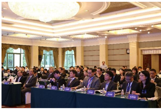
2017年兩岸保險法研討會-全場