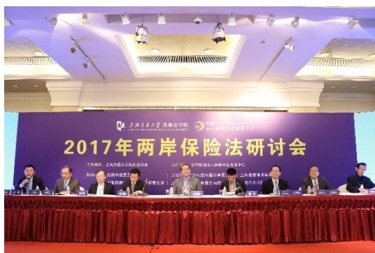
主旨演講：保險法理論的新發展