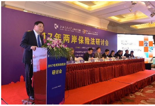
第二議題：財產保險合同疑難問題研究