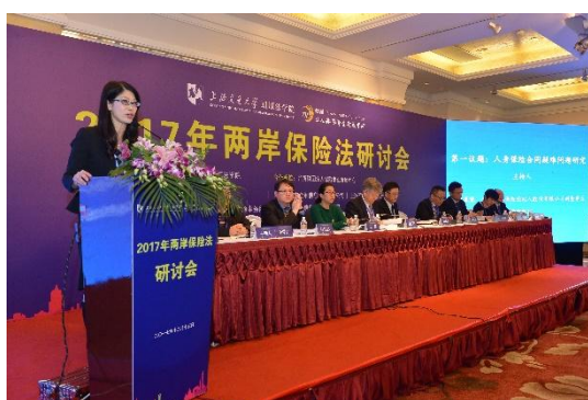
第一議題：人身保險合同疑難問題研究