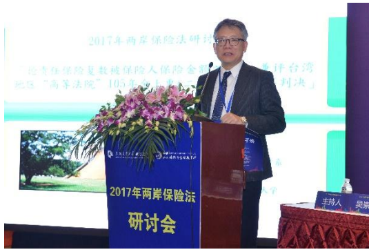
第二議題：財產保險合同疑難問題研究