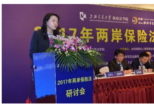
第三議題：保險業法的展望