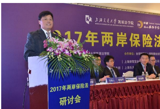
第三議題：保險業法的展望