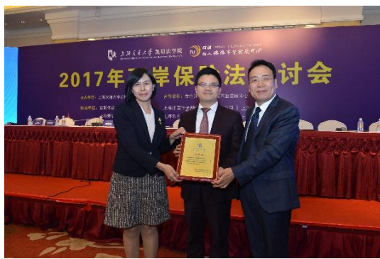
2017年兩岸保險法研討會-頒發感謝狀